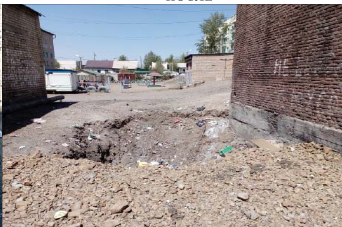
Ул. Железнодорожная, 2,4.