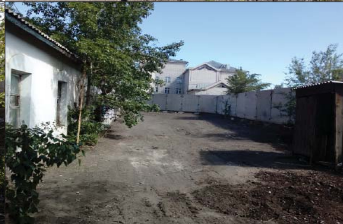
Ул. Красноармейская, 32.